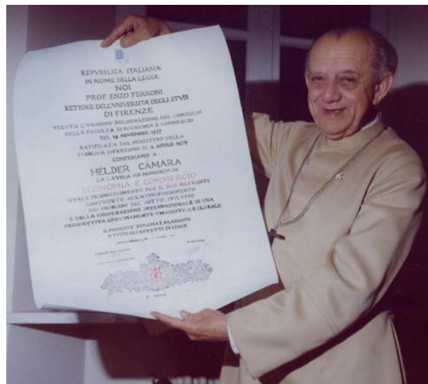
Laurea in Economia, Università di Firenze